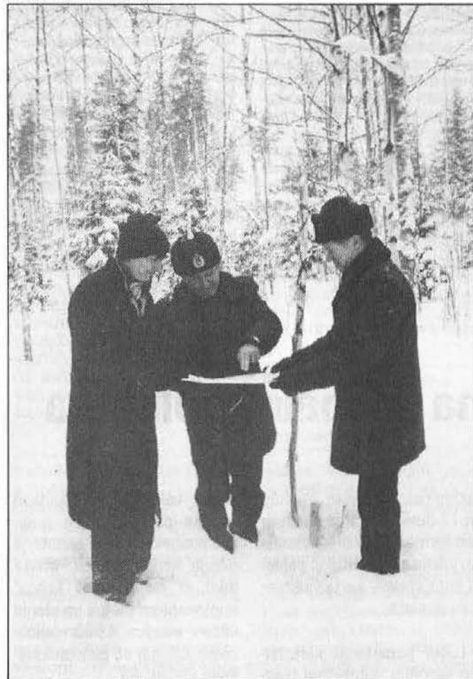
Puolen metrin hanki peittää 4 ha:n metsäpalstan, jonne palokoulun rakennukset ensi vuoden puolella alkavat nousta. Karvisen ja Krögerin välissä merkkipaalu, jonka takaa tie aikanaan halkaisee tontin.

kaisesti. Huonetilas suunnitelma on jo työn alla. Rakennustöiden suunnittelusta huolehtii kaupunki yhteistyössä rakennushallituksen kanssa.