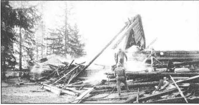
Aamulla 750 m 2 :n kirkosta oli jäljellä vain savuava raunio-kasa. Jälkisammustustyötä ja vartiointia jatkui vielä seuraavaan aamuun saakka.

Tuusniemen palokunta iltapäivällä vähän ennen 14.00.