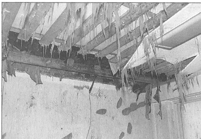
Eräs keskeisistä tutkimuskohteista on hotellihuoneiden rakenne. Väli-pohjan eristeet kehittivät voimakkaan savunmuodostuksen. Se vaikeutti pelastautumista ja aiheutti hätäännystä hotelliasukkaiden keskuudessa.