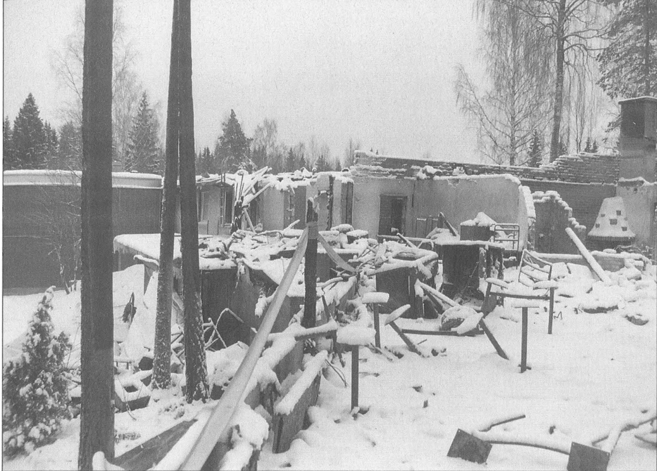
Ravintolaosa paloi perusteellisesti. Takana keskellä rakennuksen yksikerroksinen hotelliosa, takana ja vasemmalla uudempi kaksikerroksinen osuus.