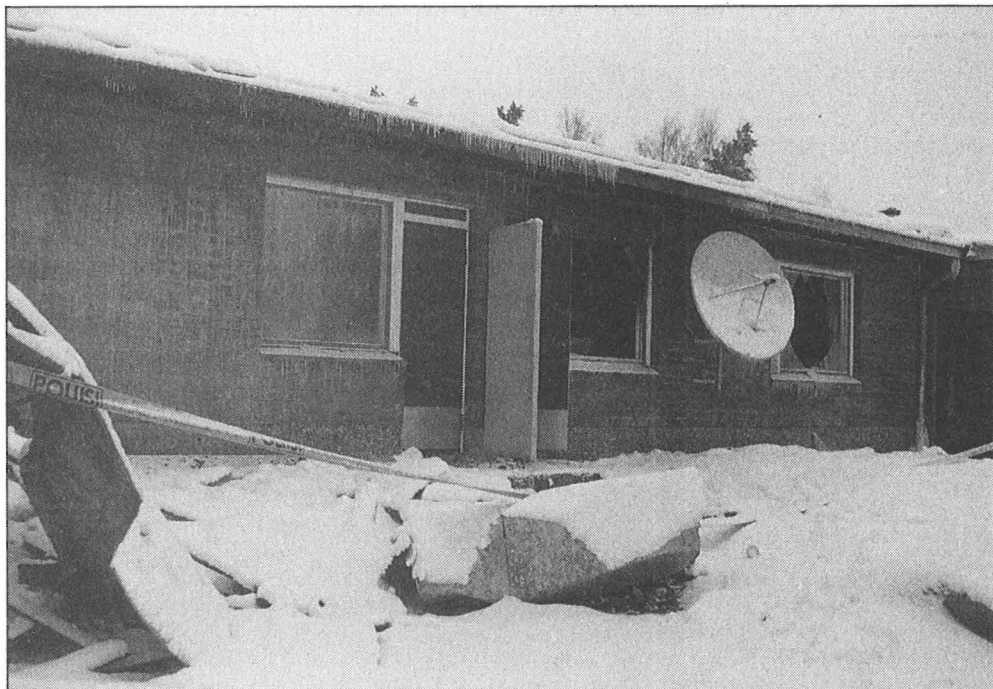
Palossa menehtyneen talonmiehen asunto. Huoltomiehenä toimineen talonmiehen ruumis löydettiin hotellin käytävältä useiden metrien päästä oman huoneen ovesta.

Menimme kaikki sisään savunkatkuiseen hotellikäytävään ja aloimme herätellä muita vieraita ovia potkimalla ja hakkaamalla. Poika huu-