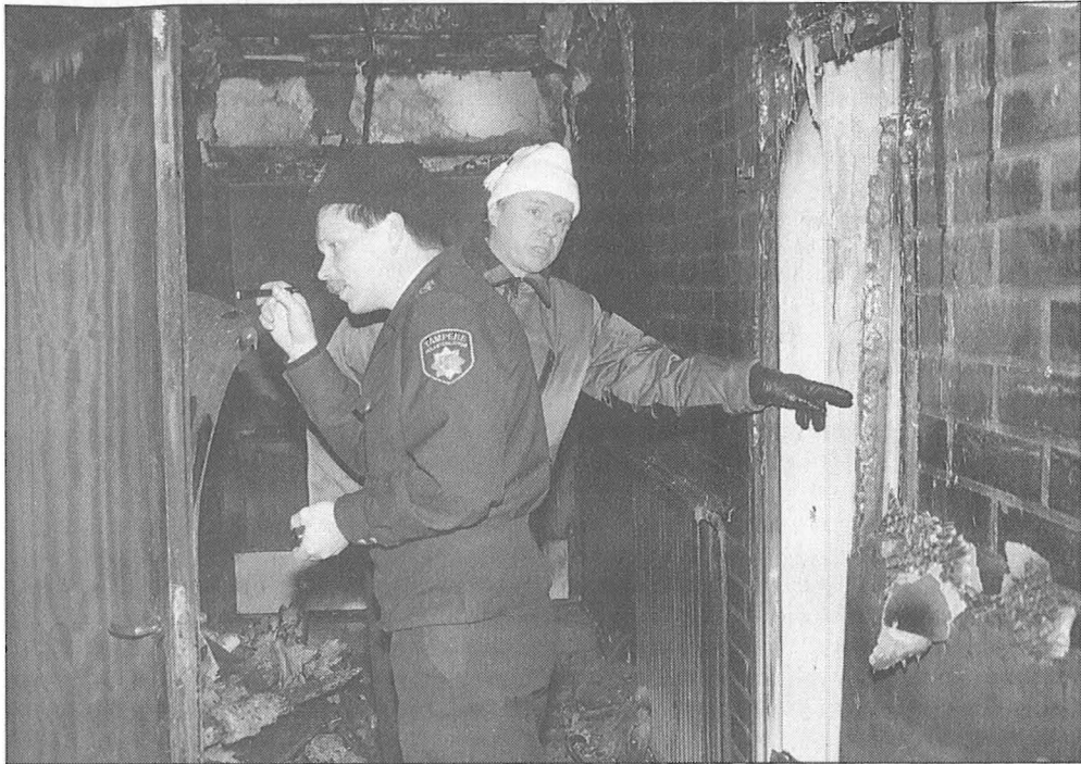
Tutkintalautakunta tutkimassa palon jälkiä vanhan osan hotellikäytävällä, josta palo takana hämmöttävästä, silloin avoimesta palo-ovesta levisi uudelle puolelle.