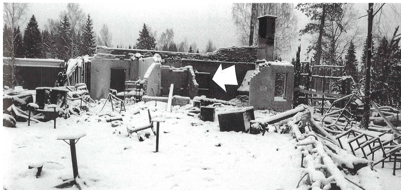
Kuva 3. Hotellin vanhan osan tyystin palanut ravintola kuvattuna viikko tulipalon jälkeen. Taustalla nuoli osoittaa ravintolan ja hotelliosan välisen palo-oven, joka paloyönä (kuten myös kuvassa) oli avoinna.

Syyttäjän mukaan palopäällikkö on 4.5.1995 toimittamas-