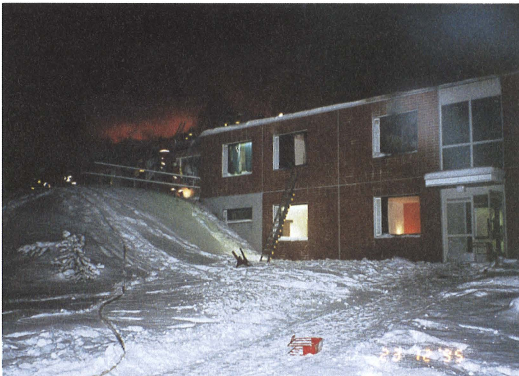
Kuva 2. Jatkettu uudisosa teki hotellista osin kaksikerroksisen. Kuva paloyöltä.

osaltaan mainittujen lainminlyöntien (palovaroittimien puuttuminen, ohjeiden ja varokeinosuunnitelman puuttuminen, ikkunakahvojen ja portaiden puuttuminen) johdosta venäläisten hotelliasekkaiden omaisuutta tuhoutui tulipalossa ja heistä ainakin 18 henkilöä sai eriasteisia vammoja, koska 2. kerroksen asiakkaat joutuivat poistumaan huoneistaan ikkunat rikkoen ja alashyptäen.