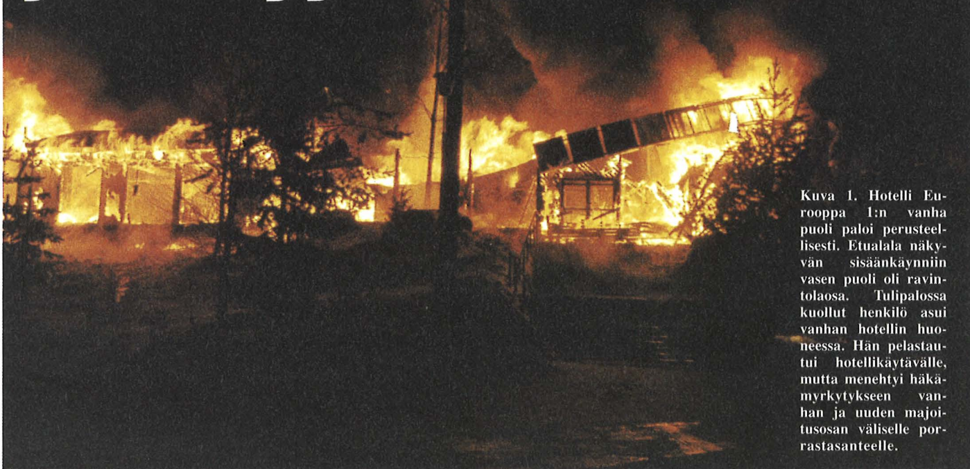
Kuva 1. Hotelli Eurooppa 1:n vanha puoli paloi perusteellisesti. Etualalla näkyvän sisäänkäynnin vasen puoli oli ravintolaosa. Tulipalossa kuollut henkilö asui vanhan hotellin huoneessa. Hän pelastautui hotellikäytävälle, mutta menehtyi häämyrkytykseen vanhan ja uuden majotusosan väliselle porstasanteelle.

T ulipalo havaittiin ohiajasta henkilöautosta 23.12.1995 klo 3.50. Yli 20 asteen pakkasessa tapahtuneeseen pelastus- ja sammutustyöhön osallistui yksiköitä Kuhmoisista, Jämsästä ja Jämsänkoskelta sekä paikalle osunut hyvinkääläinen palomestarioppilas.