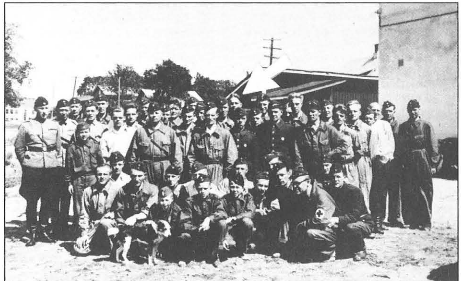
Kaarinan VPK ryhmäkuva kesällä 1941. Pitkä nuori mies takana tuleva presidentti Mauno Koivisto.