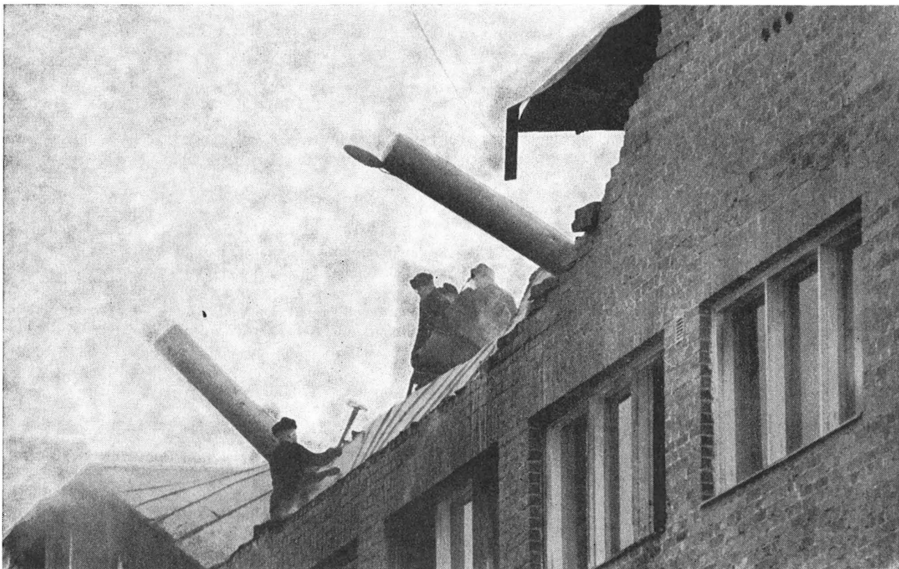
Tehtaan pitkän sivun kantava tiiliseinä putosi pölykopin kohdalta maahan n. 20 m:n matkalta.