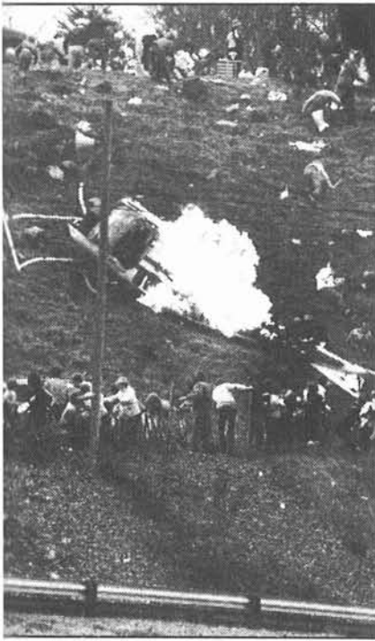
Rinnettä alas vierivä helikopteri on hetkeä aikaisemmin leimahtanut liekkeihin. Kilparadan reunalla seisleet katsojat alkavat huomata tilanteen vaarallisuuden. Helikopterin yläpuolella on roottorin lapojen mahaan lyömiä ihmisiä. Kopterin ohjaimossa olleista menehtyi yksi.

heti tapahtuman havaittuun. Tämän lisäksi radalla sen ns. suolenkin puolella ollut toinen sairaauto sai lähtökäskyn onnettomuuspaikalle. Palolaitokseltamme lähetettiin paikalle välittömästi kaksi sairaautoa ja yksi sammutusyksikkö. Tämän lisäksi hälytettiin sairaankuljetusyksiköitä naapurikunnista seuraavasti: Hattulasta yksi, Janakkalasta kaksi ja Kalvolasta yksi. Lisäksi pyydettiin virka-apua ESSLE:n päivystävältä upseerilta ja näin saatiin vielä kolme sairaautoa lisää.