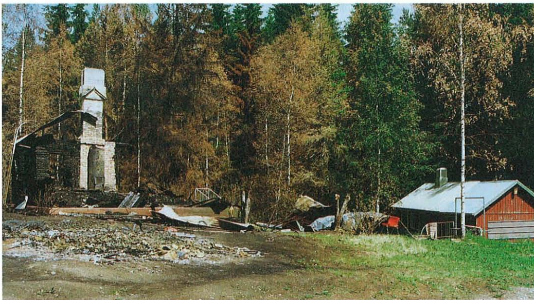
Kuva kertoo metsäpalon oikullisuudesta. Vasemmalla edessä oleva tuhkakasa jäi upouudesta hirsisaunasta, takana kivijalkaan palanut päärakennus mutta oikealla täysin säästynyt piharakennus.