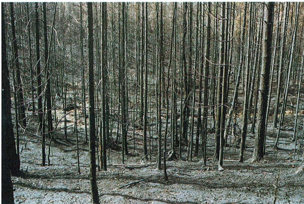
Näin palaa metsä. Aluskasvillisuus palaa tyystiin, puista rungot hiiltävät ja lehvästöt palavat pääsääntöisesti kokonaan. Toisaalta maastokohdista riippuen palo voi myös “armahtaa” (vrt. edellinen kuva).

Kuuman VPK Jokioisista, Ypäjältä palolaitos, Hämeenlinnan palolaitos ja VPK, Idänpään ja ymp. sekä läntinen VPK Hämeenlinnasta, Tarinmaan VPK Janakkalasta, Rengon ja Tuuloksen palolaitokset, Someron palolaitos ja Somerniemen VPK, Nummen ja Pusulan VPK:t Nummi-Pusulasta, Tuorilan ja Haaviston VPK:t Karkkilasta.