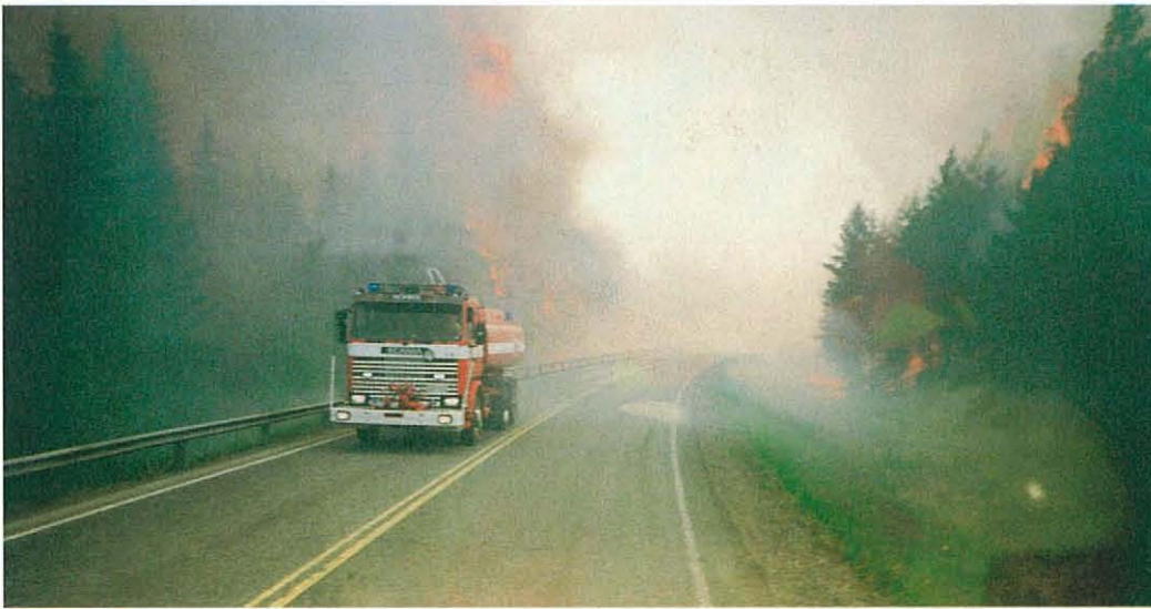
“Välillä näytti, että valtatie olisi tulossa. Palokaasut lieskahtelivat kuuman asfaltin päällä ja säiliöautomme sai pitää kiirettä, että ehti siirtyä alta uusiin aseisiin”, kuvan ottanut Eino Hirsimäki kertoo.